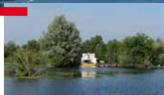
De Baambrugse Zuwe is een bijzondere plek om te vertoeven aan het water.

De Vinkeveense Plassen worden gekenmerkt door de legakkers en de ring van 12 zandeilanden. De turfwinning geven de Vinkeveense Plassen haar karakteristieke waaiervormige indeling van de vele sloten en legakkers, die vervolgens overlopen in de plassen. Deze structuur maakt dat je in dit gebied een prachtige ontdekkingsreis kunt maken. Het veenwijdeland dat overloopt in de recreatie eilanden aan de zandwinningsplas, maken het gebied verrassend afwisselend. Op de eilanden mag je aanmeren (3 x 24 uur) en kun je heerlijk ontspannen. De Vinkeveense Plassen hebben het schoonste water van de Hollandse Plassen, een perfecte plas dus om te zwemmen. Ook de duiksport heeft hier zijn eigen plek gevonden en is één van de