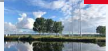
Een mooi uitzicht op de polder van Haarlemmermeer.

De Westeinderplassen, via de Oude Wetering, naar het Braassemermeer, met vaarwegen richting Nieuwkoopse Plassen, Reeuwijkse Plassen, Vinkeveense- en Loosdrechtse Plassen. De Kagerplassen zorgen voor verbinding naar Leiden en vervolgens via het Rijn Schiekanaal naar Vlietland en het Spaarne geeft toegang tot Haarlem. Welkom op de Ringvaart!