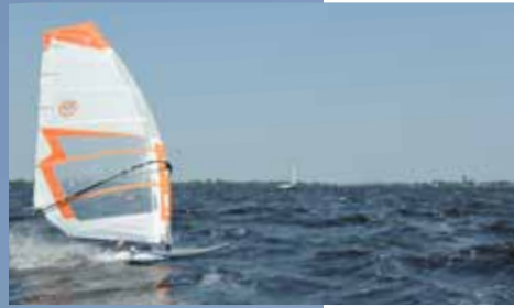
Windsurfer bij recreatie eiland Vrouwentroost op de Grote Poel.