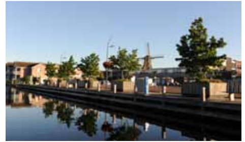
De Dorpshaven van Aalsmeer, midden in het gezellige centrum.