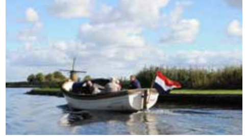
Rond de Kagerplassen ervaar je het pure Hollandse landschap met molens.