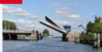
Haarlemmermeer heeft 28 bruggen over de Ringvaart.

Welkom op de Ringvaart van de Haarlemmermeerpolder