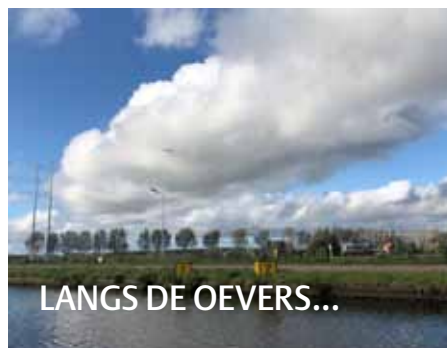
LANGS DE OEVERS...