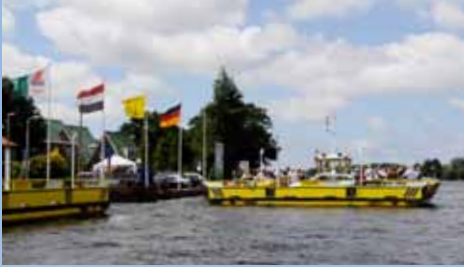
Het pontje naar Kaageiland brengt je naar een 'andere' wereld.