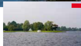
Starteiland (nr 8) is het grootste eiland in de Vinkeveense Plassen.

drukste zoetwater duikstekken van Nederland. De zandeilanden zijn ideaal voor iedere watersporter. De toegangssluisen, de Proostdijersluis aan de noordzijde en de Demmerikse sluis aan de zuidzijde, geven iedere watersporter een warm welkom tot de Vinkeveense Plassen. Vanaf Nieuwkoop vaar je door de Oudhuijzersluis en vanaf Mijdrecht vaar je via de Pondschoeksluis. Welkom op de Vinkeveense Plassen.