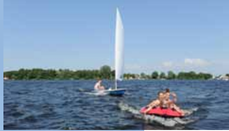
Zeilen of funsport; voor iedereen is er plek op de veelzijdige Kagerplassen.