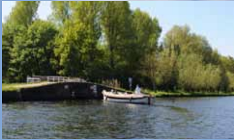
Vanaf het Rijn-Schiekanaal (de Vliet) kun je Vlietland makkelijk bereiken.