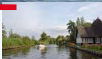
De bekendste straat van Loosdrecht en Amsterdam; de Kalverstraat.

De plassen van noord naar zuid, zijn de Eerste tot en met de Vijfde Plas, waar de Vijfde Plas het domein is van zwemmers en surfers. De Vuntusplas, Breukeleveense of Stille Plas en het Wijde Blik maken dit vaargebied compleet. De plassen zijn ontstaan uit veenwinning in de 17e en 18e eeuw. Er zijn een vijftal openbare recreatie-eilanden en ook aanlegplaatsen die gemarkeerd worden door een paal met gele kop. Er mag maximaal drie dagen afgemeerd worden. Bij De Strook, de Wastobbe en de eilanden Meent en Marcus Pos kun je veilig zwemmen. Via de Vecht, met zijn prachtige landhuizen, vaar je door sluis 't Hemeltje over het Hilversums Kanaal (afslag naar het Wijde Blijk) naar de Raaisluis. Vervolgens vaar je over de Oostelijke