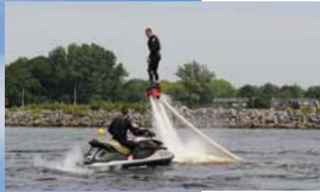
Flyboarden is een extreme watersport die je op Vlietland kunt leren.