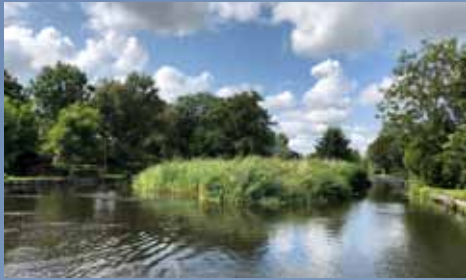
De Drecht is een doorvaart in de prachtige Bovenlanden.