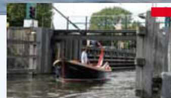
Het Hemeltje is één van de sluisen richting de Loosdrechtse Plassen.

Drecht naar de Wastobbe. Vaar je de Vecht af richting Breukelen dan kun je via de Mijndense Sluis, de Weersluis of de Kraaienestersluis de plas op. De Kalverstraat is een begrip in Loosdrecht; een oogstrelende vaarweg met eilandjes met huizen en bloeiende hortensia's. Overnachten in een hotel of B&B is zeker aan te raden in deze pittoreske omgeving. Welkom op de Loosdrechtse Plassen.