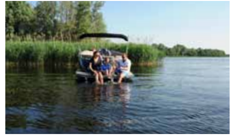
Even aanleggen in het riet om te zwemmen met de familie.